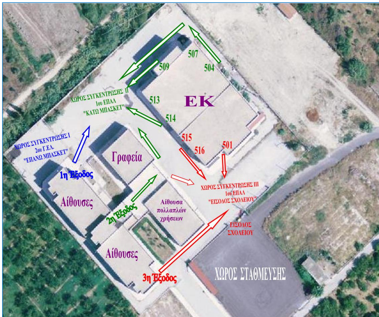
Σχέδιο αποχώρησης λόγω έκτακτων συνθηκών

Σε περίπτωση έκτακτης ανάγκης, για την ασφάλεια των παιδιών έχει καταρτιστεί σχέδιο διαφυγής και προς τούτο πραγματοποιούνται τακτικά ασκήσεις ετοιμότητας.